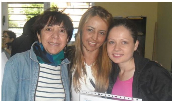
Acto de entrega de diplomas "Aprendizaje de la lengua y cultura del país de acogida", junio de 2015

Este análisis tal vez esté excesivamente centrado en los aspectos a mejorar pero la propia supervivencia de las asociaciones sin ánimo de lucro y, por tanto, la mejora de la calidad de vida